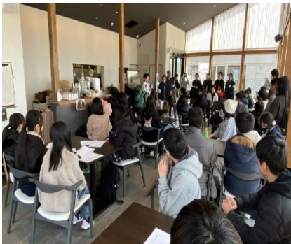
泉ピークベースに到着

夕食作りでは東北地方の郷土料理「芋煮」の調理を体験しました。BBQでは火おこしや食材の焼き方を学び、協力しながら食事を楽しみました。焚火を囲んだ交流、スカイランタン・リリース、星空観賞、天然温泉に入浴し、自然の雄大さを感じる時間となりました。