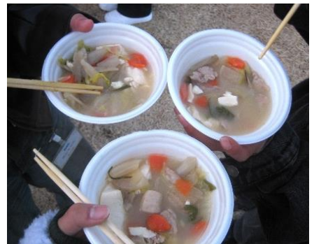
東北地域の郷土料理「芋煮」を調理