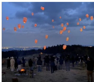
スカイランタン・リリース