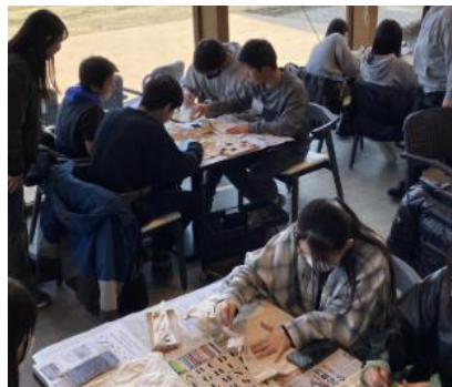
オリジナルエコバッグ作り