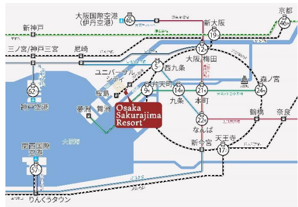
交通アクセスマップ

本計画地は、船着場であるユニバーサルシティポートにも近接しており、舟運による大阪市内へのアクセスも可能です。将来的には、関西国際空港や神戸空港からの海上アクセスも期待されています。