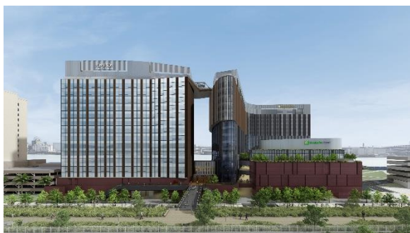
ユニバーサル・スタジオ・ジャパン側 外観パース

西側は、ブルックリンの街並を想起させる重厚感のあるイメージとし、東側は、安治川の煌めく水面を映し出す、開放的で透明感のある佇まいとしています。都市と自然が交差する風景の中に調和を描き出し、この土地ならではの体験価値を提供するディスティネーション（旅の目的地）を目指しています。