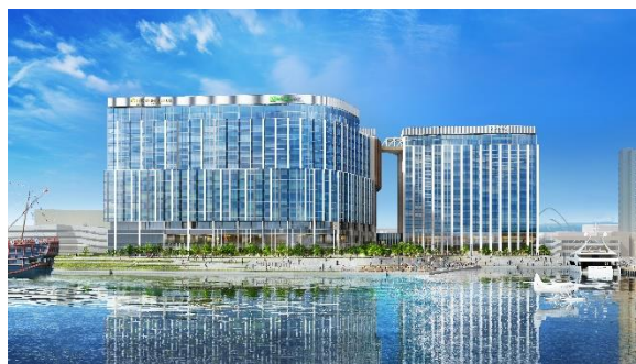
安治川側 外観パース