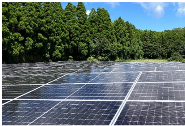
【バーチャル PPA に取り組む太陽光発電設備】

三井住友ファイナンス&リース株式会社（以下「SMFL」）の戦略子会社、SMFL 未来パートナーズ株式会社（以下「SMFL 未来パートナーズ」）とヤンマーホールディングス株式会社（以下「ヤンマーホールディングス」）、およびヤンマーエネルギーシステム株式会社（以下「ヤンマーエネルギーシステム」）の3社は、バーチャル PPA ※1 の仕組みを活用し、PPA では国内最大規模となる 150MW（直流容量換算、以下同じ）の再生可能エネルギーの供給に関する基本合意契約を締結しました。